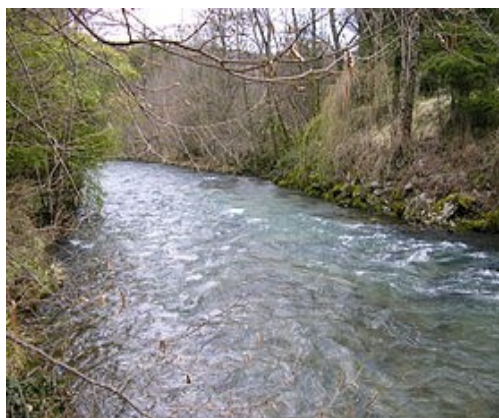
L'hers vis à Belesta

"La nymphe en fait ça va être plus important dans le choix de vos coups de pêche. Autant la sèche vous trouverez des courants lents dans n'importe quel cours d'eau, en nymphe vous allez chercher des cours d'eau les plus adaptés à ce que vous aimez faire. S'il faut pêcher lourd, moi, je n'irai pas, je préfère pêcher léger. Je vais chercher des cours d'eau avec des petits radiers ... L'Hers, l'Hers c'est une rivière parfaite pour ma pêche, en plus il y a du poisson, c'est une rivière sympa. Et pour ceux qui un jour veulent se mettre à la nymphe je trouve que c'est une bonne école parce-que il n'y a pas besoin de pêcher gros. "