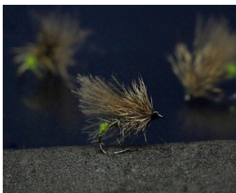
Sedge Cul vert (Halieutique) -

Pascal: “Ces ne sont pas des tricoptères, plus-tôt des plécoptères, ce que l’on appelle des aiguilles. Elles n’ont pas les ailes en toit, mais à plat. ”