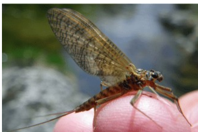
Ecdyonurus spec. subimago femelle

Pascal: “Le printemps est là, les eaux commencent à se réchauffer, qu’est-ce qu’on va trouver comme mouche sur les eaux , pas de nymphe , on va parler de sèches . Encore les Baetis, d’accord, et une mouche assez grande, l’ecdycio avec son vol pendulaire”