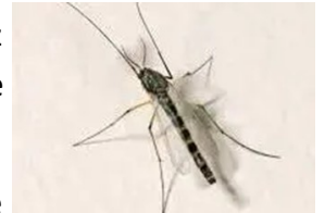
Chironomidae — Wikipédia

Pascal: " Dans les Pyrénées le temps un peu frais sera un peu plus long que chez moi, ou sur le Tarn, mais il y a un moment où çà se calme...juillet, le problème c'est les insectes , il n'y a pratiquement plus rien, il y a les chironomes. "