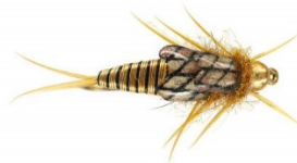
Montage (1000 mouches )

“Il y a aussi les coups du soir, dans le mois de juin, allez-y, profitez, c’est là où vous avez les grands sedges, c’est là où les beaux poissons sortent le soir .”