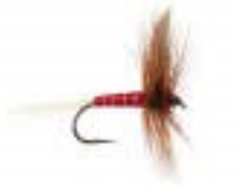
red spinner (1000 mouches)

“Mouche super importante dans les Pyrénées, où il y en a beaucoup. Dans le montage ça s’appelle des spinners, on monte généralement sur des H10 après vous pouvez monter sur du 12 , 14 & 16 . Vous les voyez le matin et le pré-coup du soir quand les femelles viennent pondre ”.