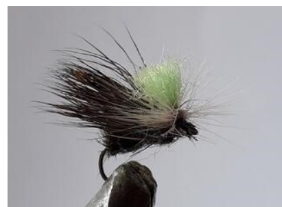
Le Tavanas de Philippe Seguin, son inventeur

Les sedges, je mets des très petits, montés sur du 18, et des très gros aussi pour pêcher les courants rapides "