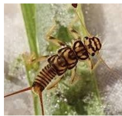
Larve de stone fly