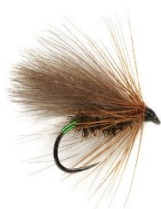
Sedge cul vert (La boîte à mouche)