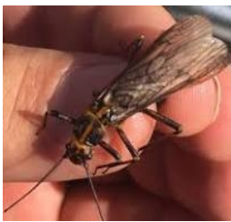
Stone fly et

Pascal: “En juin il y a aussi des perlidés. La perlidée qu’on appelle la stone fly , la grande perle , honnêtement, ne vous fatiguez pas à monter ça , elles ne le bouffent pas au stade adulte .Par contre la larve elle est mangée ”