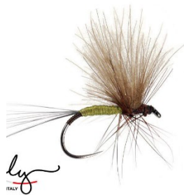
BWO de 1000 mouches –