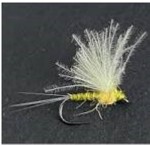
Bwo de Caleri fishing -

Pascal: “Sur le Sud Aveyron ,c’est là que je vais le plus souvent , c’est tout le mois de juin ; même sur le Tarn .”